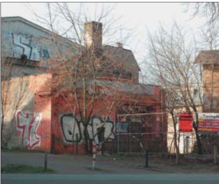
Das „Charlott“-Kino gammelt vor sich hin...

gen begreifen, damit nicht eine Kette von ungewollten Folgeentscheidungen durch Sperrung der Friedrich-Ebert-Straße losgetreten wird! Auch die Verbindung der Verkehrskonzepte von Potsdam und dem Umland muss erarbeitet werden, für Bahn und Bus aber auch für Kraftfahrzeuge aller Art, von denen bereits jetzt 54% mit Kennzeichen PM oder B oder übrigen auf der Langen Brücke in Potsdams Mitte gezählt wurden! Das Potsdamer Verkehrsproblem wird sehr wohl anteilig auch durch die Umlandgemeinden erzeugt. Und wir können nicht zulassen, dass uns weiter einzelne Vertreter des Umlands bei der Klärung, ob eine Havelspanne am Templiner See nützlich wäre oder nicht, auf der Nase rumtrampeln und eine sachliche Abwägung im Interesse der Mehrheit der Bürger behindern. Alle getroffenen Entscheidungen wirken in Zusammenhängen: Stadtteil und Stadtzentrum, Potsdam und Umland, Sachentscheidungen und finanzielle Auswirkungen. Nur wer diese Zusammenhänge beachtet, kann erfolgreich Bürgeranliegen umsetzen.