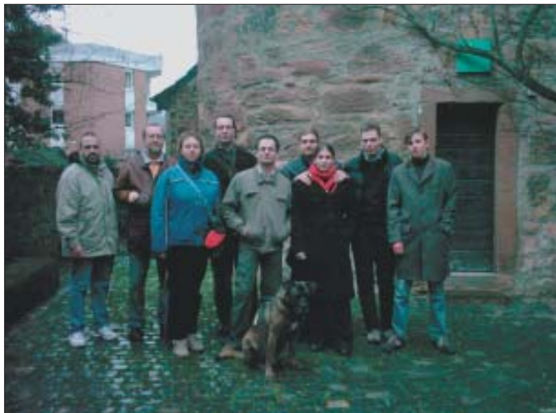
Vor dem „Roten Turm“ in Weinheim.

Schnell wurde klar: In den alten Bundesländern entwickelt die Vereinigung von Linkspartei und WASG noch eine wesentlich höhere Dynamik, als wir dies in Brandenburg erleben. Das wird schon in der Mitgliederentwicklung deutlich. Noch im November hatte beispielsweise die Weinheimer Linke 15 Mitglieder. Inzwischen sind es 21 und die Vereinigung mit der WASG ist praktisch bereits vollzogen. Bei den Partnern in Geislingen fällt der gerade erst gegründete Regionalverband dem neuen Parteistatut zum Opfer und wird zum ordentlichen Kreisverband Göppingen. Die Linke hat dort ca. 15, die WASG 38 Mitglieder. Auch hier gibt es eine gute Zusammenarbeit und personelle Überschneidungen. Die Weinheimer hatten ja schon im Landtagswahlkampf 2006 Unterstützung aus Potsdam erfahren und damit das zehntbeste Ergebnis von 70 Wahlkreisen eingefahren. Der Kontakt mit den Geislingern war