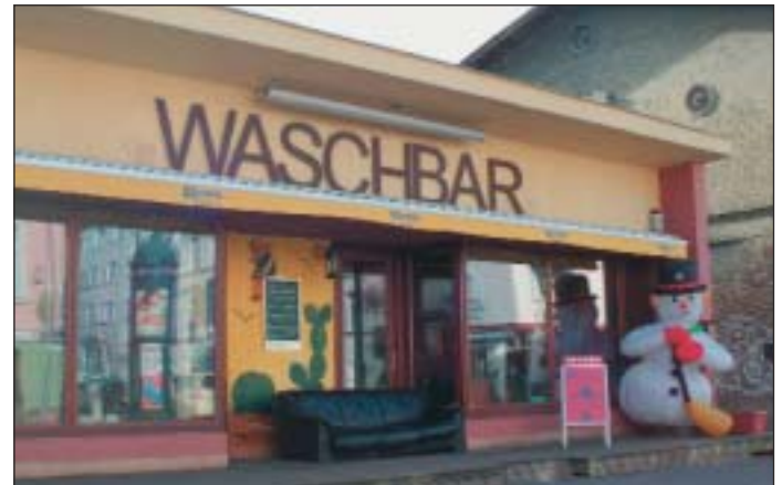
Gern besucht: Die „Waschbar“ in Potsdam-West.

Auch die unselige Debatte, ob man dann doch noch eine ISES quer durch Potsdam-West bauen sollte, würde neue Spekulationen erfahren, obwohl bereits jetzt jedem vernünftigen Menschen klar ist, dass unmöglich eine Stadtautobahn verträglich zur Kreuzung Zeppelin- / Nansenstraße geführt werden könnte. Ich werde mein Wahlversprechen halten und weiterhin strikt gegen solche Pläne auftreten. Aber auch die anderen Stadtverordneten müssen den Zusammenhang der verschiedenen Teilentscheidun-