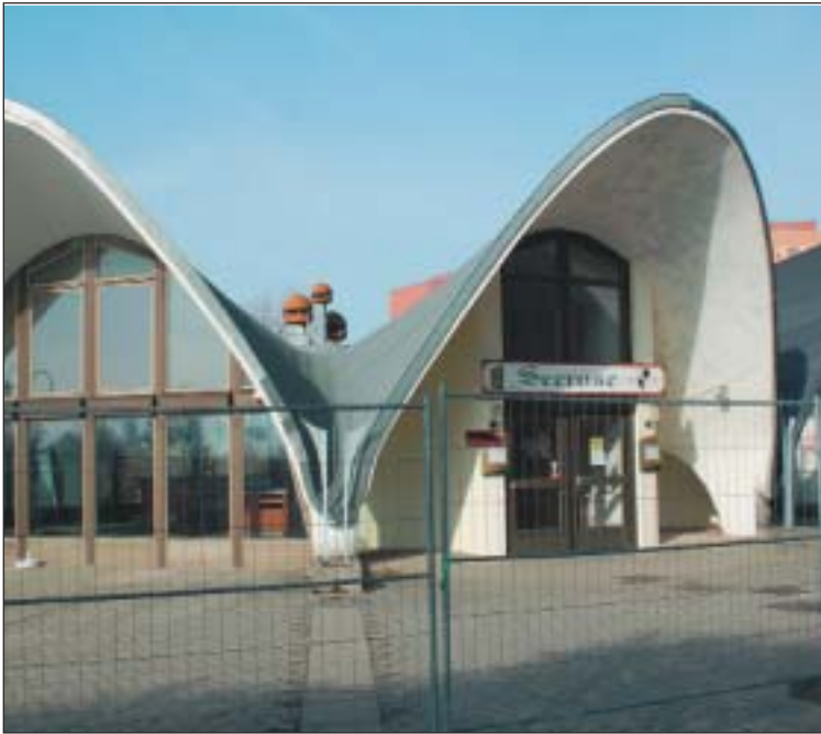
Die „Seerose“ sucht seit Kurzem neue Betreiber.