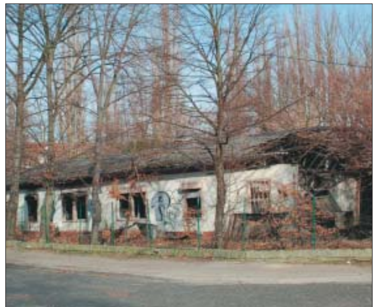
Und hier soll der „Momper-Bau“ hin...