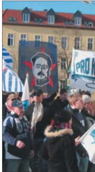
Die „Pro-Karli-Demo“ in Babelsberg.

gen dauerhaft entfernt würden, nicht den Forderungen für internationale Spiele genügen. Und wer wollte den Leichtathleten erklären, dass sie nicht mehr Sport treiben dürfen, weil jemand auf die