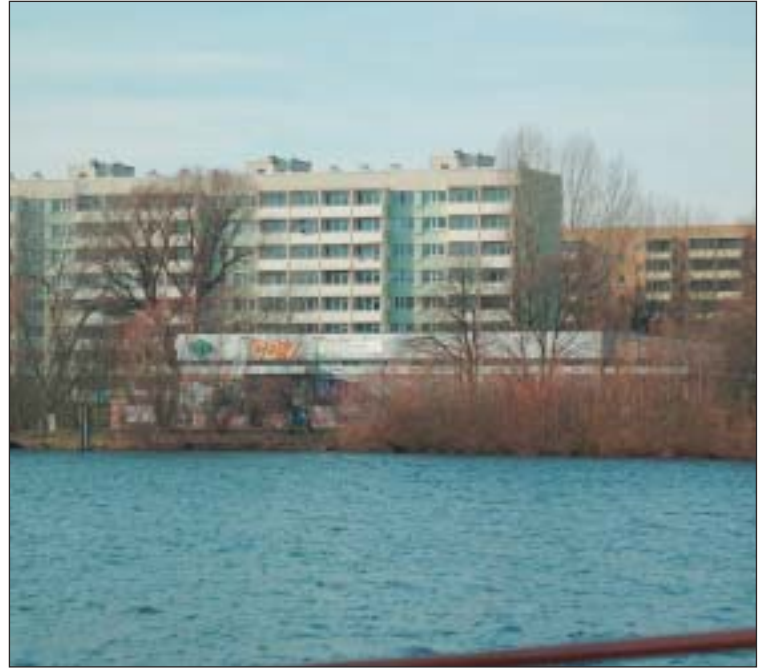
Seit vielen Jahren ein Schandfleck: die „Ufergaststätte“.