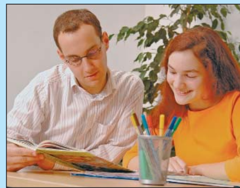
So macht lernen Spaß...

Weitere Informationen erhalten Sie unter der kostenlosen Hotline 0800-1224488 (aus dem Festnetz) oder unter www.abacus-nachhilfe.de .