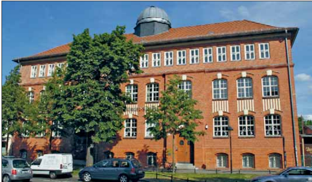
Die Bruno-H.-Bürgel-Schule (oben) und die Goetheschule in Babelsberg.