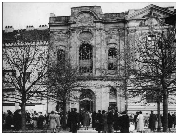
Die von den Nationalsozialisten zerstörte Potsdamer Synagoge nach der Pogromnacht 1938.

Potsdamer Synagogengemeinde e.V.“ aus dem Vereinsregister gelöscht. Die Mindestzahl von drei Mitgliedern war nicht mehr gegeben.