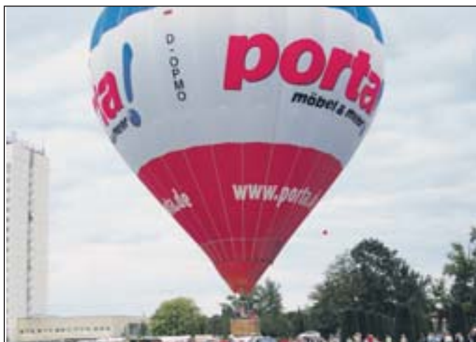
Die „porta“-Ansiedlung – ein Knüller, den sich die LINKE zuschreiben kann. Deshalb stieg auch zum Sommerfest 2008 der Ballon in die Höhe.

beitslosigkeit weiter abzubauen. In Potsdam wirken derzeit 5.000 Wissenschaftlerinnen und Wissenschaftler und 21.000 Studierende, deren Arbeitsergebnisse stärker für die unmittelbare wirtschaftliche Entwicklung zu nutzen sind. Dies soll durch weitere attraktive und vor allem familienfreundliche Angebote erreicht werden. Ich sehe die Zukunft für das Arbeiten in Potsdam nicht nur im Dienstleistungssektor, sondern auch in qualifizierten, wissensintensiven Arbeitsplätzen, in kleinteiligen, vernetzten und hochanpassungsfähigen Unternehmen, im Bereich der Filmproduktion. Aber auch die Kommune ist mit