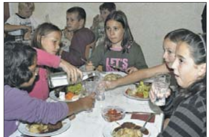
Kostenloses Schulessen für bedürftige Kinder – eine Forderung, die DIE LINKE weiter aufrecht erhält.

raum überhöhte Mieten, Kautionen und Provisionen gezahlt werden müssen. Vom Defizit an kleinen Wohnungen sind vor allem junge Erwachsene und sozial Benachteiligte betroffen. Für sie ist der Wohnungsmarkt sehr eng und begrenzt. Die Bauvorhaben, die derzeit realisiert werden, sind vor allem auf private Initiativen zurückzuführen und überwiegend auf teurere Preissegmente ausgerichtet. Doch Wohnen darf in Potsdam nicht zu einem Privileg werden. Hier besteht dringender Handlungsbedarf, denn ohne ein energisches Handeln der Stadt wird eine zunehmende Wohnknappheit die ohnehin hohen Mie-