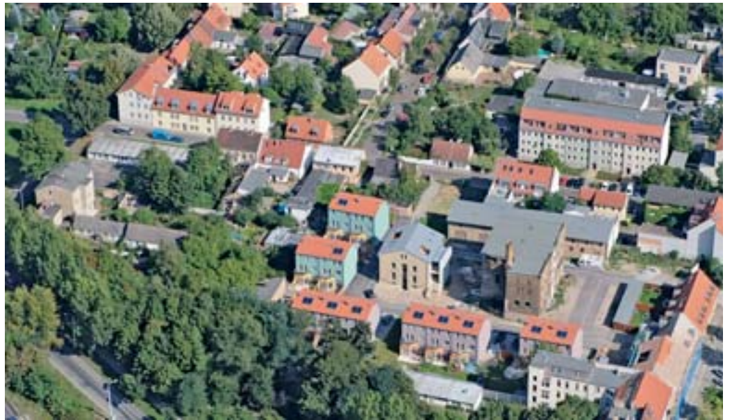
Vorbildliche energetische Sanierung zwischen Alt Nowawes und Mühlenstraße in Babelsberg.

Gravierende verteilungspolitische Mängel bestehen auch hinsichtlich der Gefahr einer Umle-