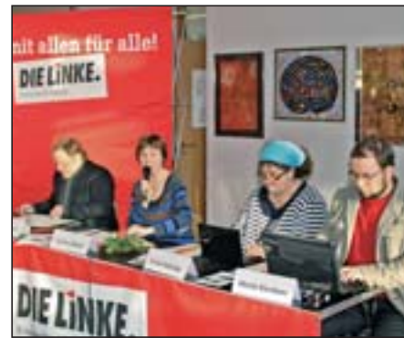
Das Präsidium arbeitet.

Erwähnt sei hier die hitzige Debatte um Transparenz und Sponsoring der städtischen Unternehmen . DIE LINKE bekennt sich klar zu starken städtischen Unternehmen. Sponsoring