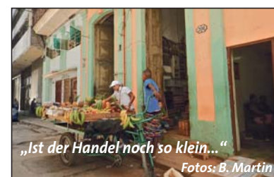
„Ist der Handel noch so klein...“