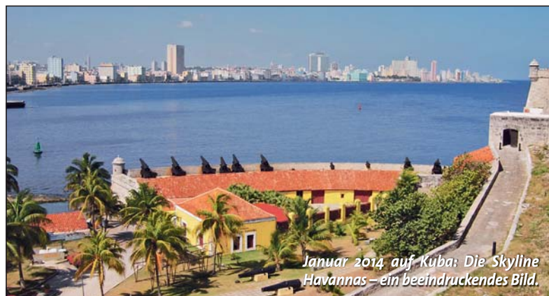
Januar 2014, auf Kuba: Die Skyline Havannas – ein beeindruckendes Bild.

Deshalb bietet die AG Cuba Sí unter dem Titel „Wohin führt der Weg Kubas?“ Vortrag und Diskussion über die gegenwärtigen wirtschaftlichen und sozialen Herausfor-