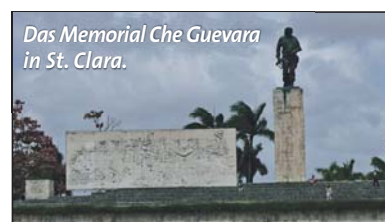
Das Memorial Che Guevara in St. Clara.

Das Angebot ist kostenlos. Bei Interesse wendet Euch bitte an Cuba Sí in Berlin, Tel. 030 2400 9455 bzw. berlin@cuba-si.org