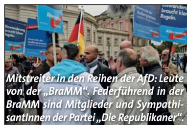
Mitsreiter in den Reihen der AfD: Leute von der „BraMM“. Federführend in der BraMM sind Mitglieder und SympathisantInnen der Partei „Die Republikaner“.

tonte später in seiner Regierungserklärung im Landtag: „Was jetzt zählt, ist Integration, Integration und Integration.“ „Flüchtlinge und Asylbewerber gehören mitten in unsere Gesellschaft, Tür an Tür mit Brandenburgerinnen und Brandenburgern“, sagte Woidke weiter. „So kann Integration gelingen – und daran müssen wir arbeiten.“ Ralf Christoffers, Fraktionschef der LINKEN, erklärte: „Die Flüchtlingssituation ist eine fordernde, aber sie überfordert uns nicht - sie zwingt uns dazu, Entscheidungen schneller zu treffen.“