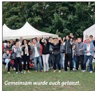
Gemeinsam wurde auch getanzt.

lung unkompliziert zum Dorffest kommen konnten. Und er hatte auch in seinem Deutschunterricht die ausländischen Gäste mit den gängigen Floskeln für die Bestellung von Imbiss und Getränken ausgerüstet. Auf einmal waren sie da, erwartet auch vom Internationalen Bund, der die Unterkunft betreibt und am Stand des Ortsbeirates für Informationen zur Verfügung stand. Nach kurzen Begrüßungsworten in deutsch und arabisch sprach die Beigeordnete Elona Müller-Preinesberger, die den Oberbürgermeister vertrat und für die