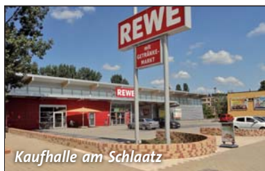
Kaufhalle am Schlaatz