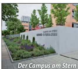
Der Campus am Stern