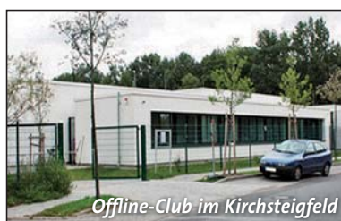
Offline-Club im Kirchsteigfeld