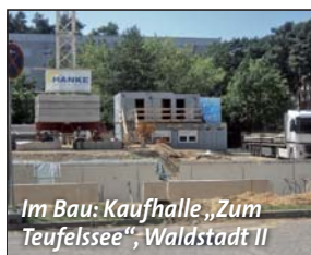
Im Bau: Kaufhalle „Zum Teufelssee“, Waldstadt II