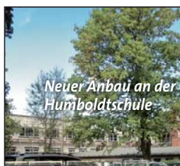
Neuer Anbau an der Humboldtschule